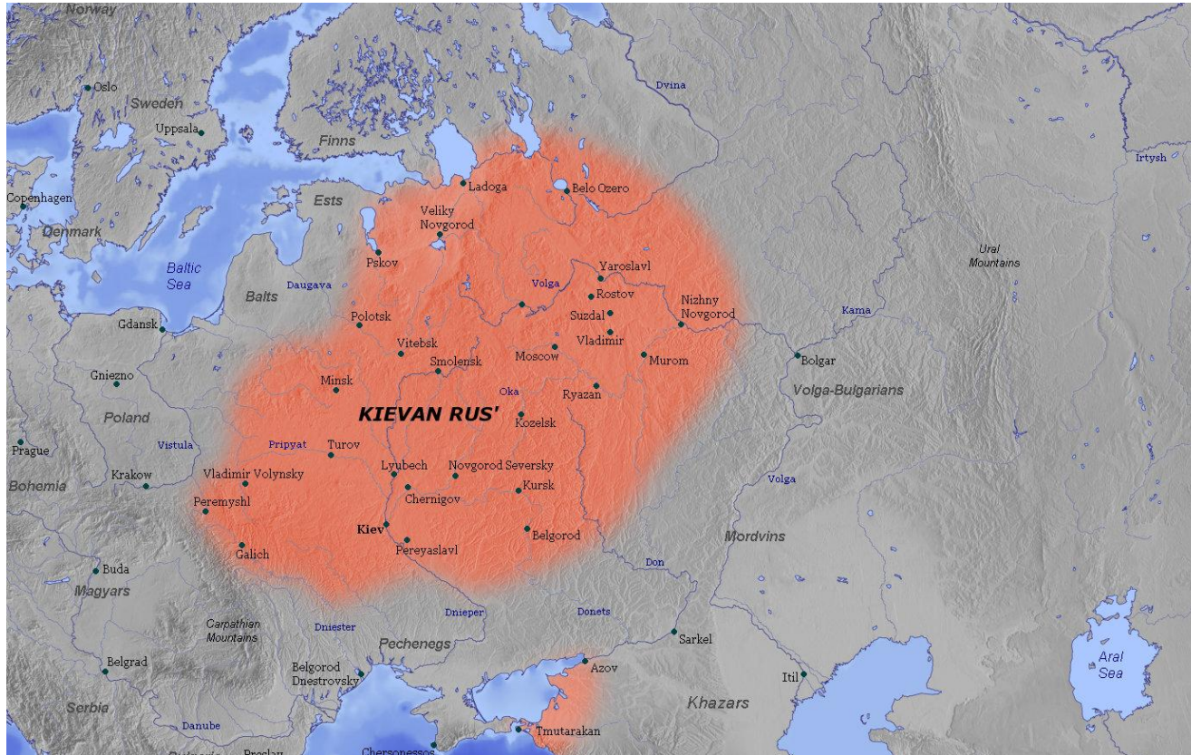
Εικόνα 1: Χάρτης του κράτους του Κιέβου.