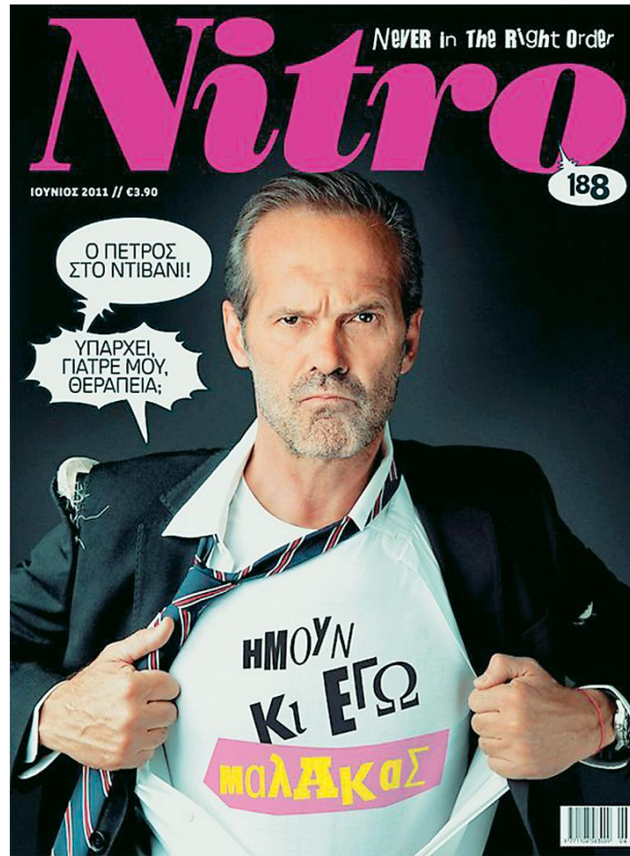
Εικόνα 1: Περιοδικό Nitro (Ιούνιος 2011)