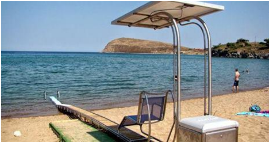
Εικόνα 1: Διάδρομος πρόσβασης στη θάλασσα για Άτομα με Αναπηρίες