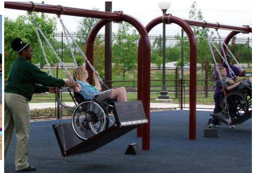
Εικόνα 2: Κούνια για Παιδιά με Αναπηρίες