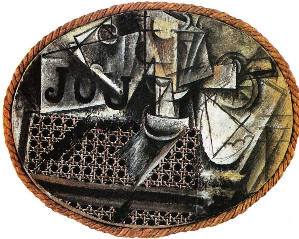
1050J. Pablo Picasso, Νεκρή Φύση με Πλεχτή Καρέκλα, 1912, Κολλάζ, 27X35 εκ. Μουσείο Picasso Παρίσι

Εισαγωγή στην Ιστορία της Τέχνης και του Πολιτισμού