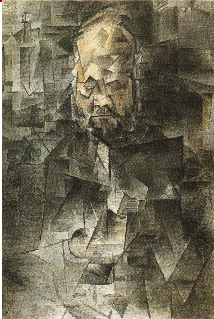
1048J. Pablo Picasso, Πορτραίτο του Ambroise Vollard, 1910, Ελαιογραφία. 92X65 εκ. Κρατικό Μουσείο Καλών Τεχνών Pushkin Μόσχα