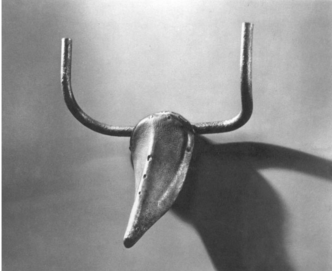
Pablo Picasso, Ταύρος