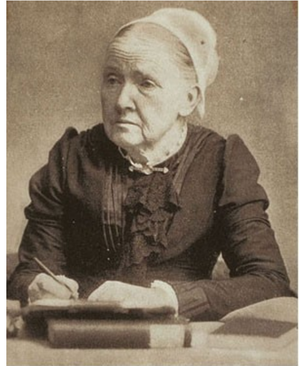
Portrait of Julia Ward Howe, ca. 1898. From the Julia Ward Howe Papers, 1857-1961. Schlesinger Library, Radcliffe Institute.