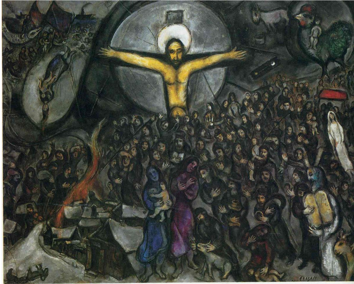
105 Exodus (1952-66)

http://www.wikiart.org/en/marc-chagall/exodus-1966 [14.5.2014]