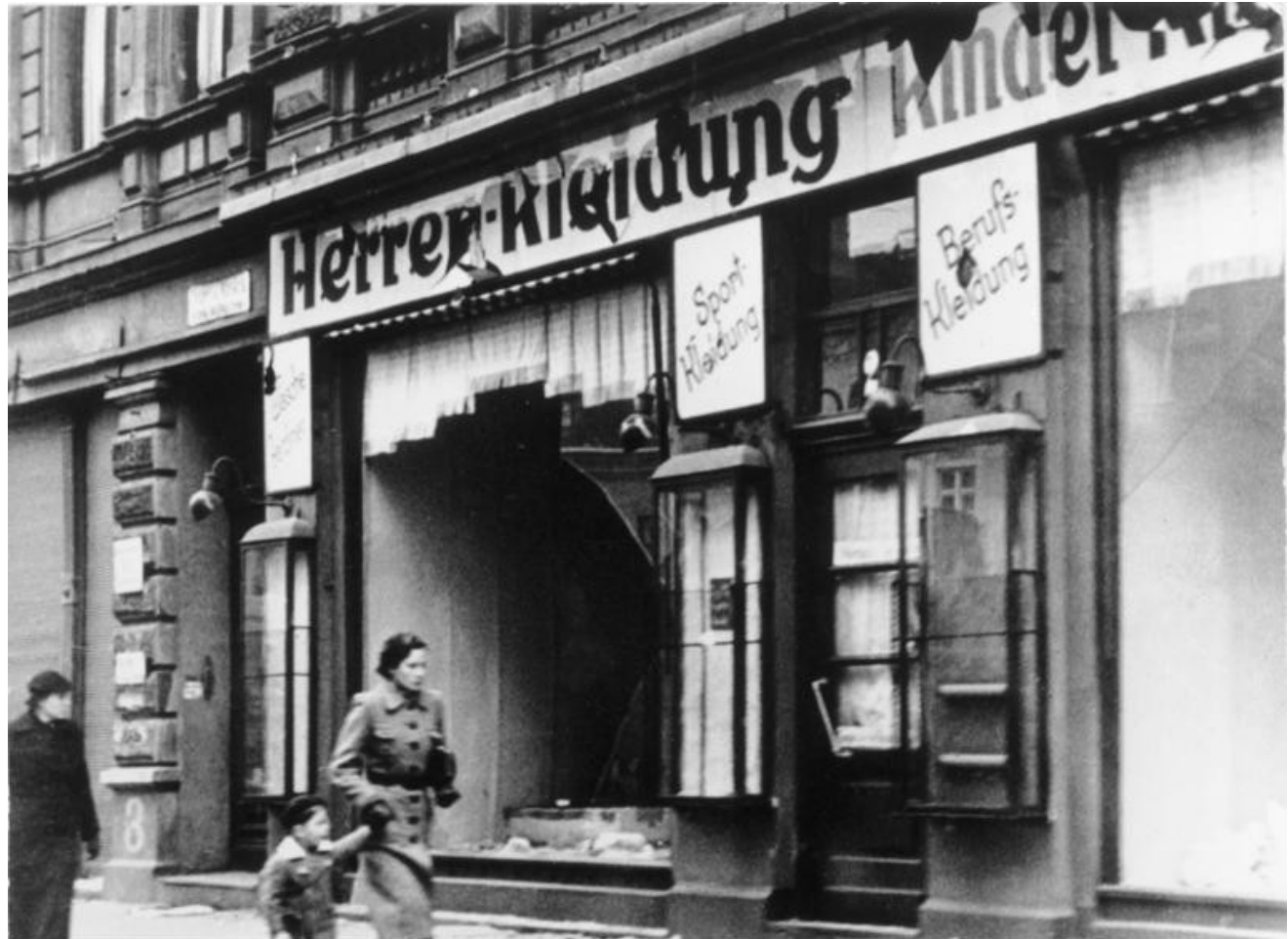
November 1938

https://upload.wikimedia.org/wikipedia/commons/f/f9/Bundesarchiv_Bild_146-1970-083-44%2C_Magdeburg%2C_zerst%C3%B6rtes_j%C3%BCdisches_Gesch%C3%A4ft.jpg