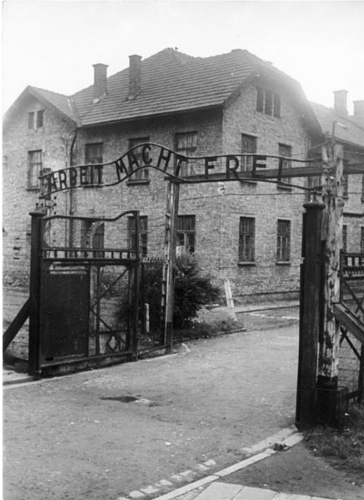
11. August 1955