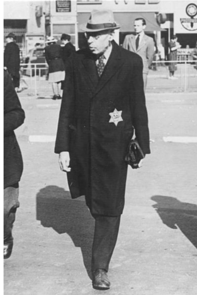
Bundesarchiv, Bild 183-L20273 Foto: o.Äng. | September 1941