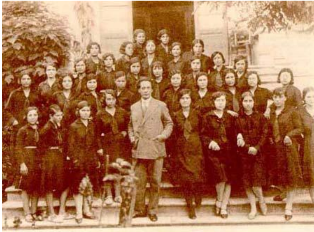
Ο Κουντουράς με τις μαθήτριες του σχολείου (Αριστοτέλειο Πανεπιστήμιο Θεσσαλονίκης, Παιδαγωγικό Τμήμα Δημοτικής Εκπαίδευσης, Μίλτος Κουντουράς, Εκατό χρόνια από τη γέννησή του , Εκδόσεις Βάνιας, Θεσσαλονίκη 1991)