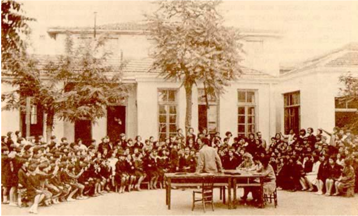
Η «Συγκέντρωση της Πέμπτης» (Α. Δημαράς (επιμ.), Μ. Κουντουράς, Κλείστε τα Σχολειά , (Εκπαιδευτικά Άπαντα), τομ. Β΄, Εκδόσεις Γνώση, Αθήνα 1985)