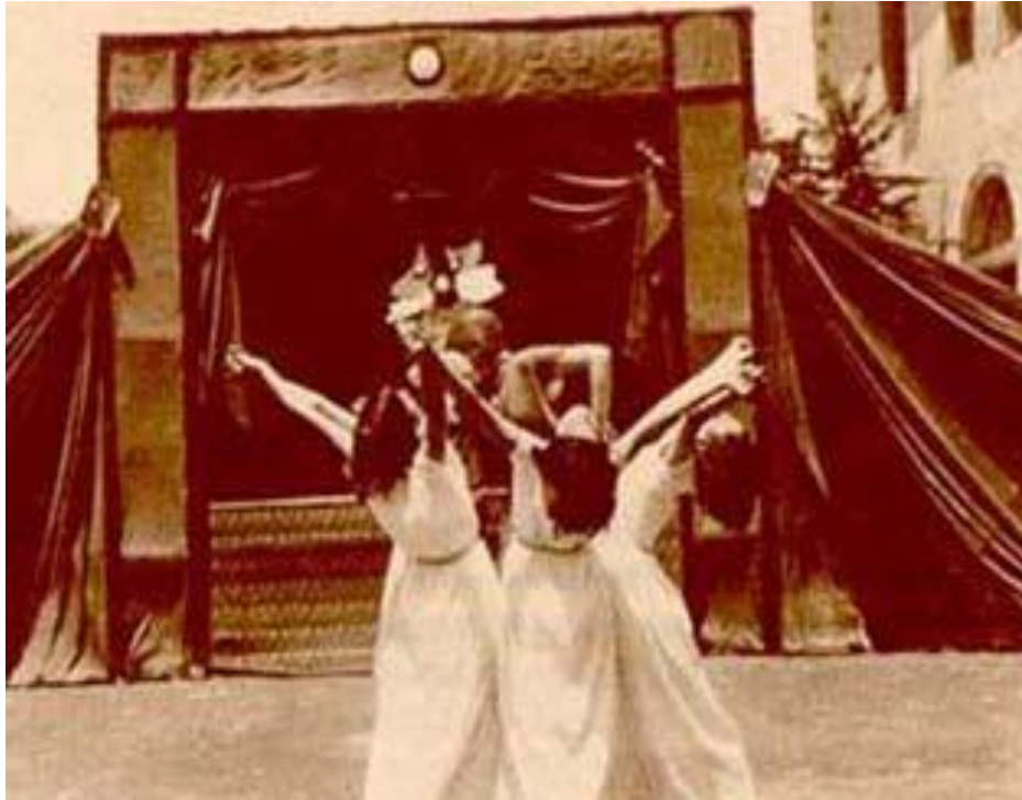
Θεατρική παράσταση (Αριστοτέλειο Πανεπιστήμιο Θεσσαλονίκης, Παιδαγωγικό Τμήμα Δημοτικής Εκπαίδευσης, Μίλος Κουντουράς, Εκατό χρόνια από τη γέννησή του , Εκδόσεις Βάνιας, Θεσσαλονίκη 1991.)