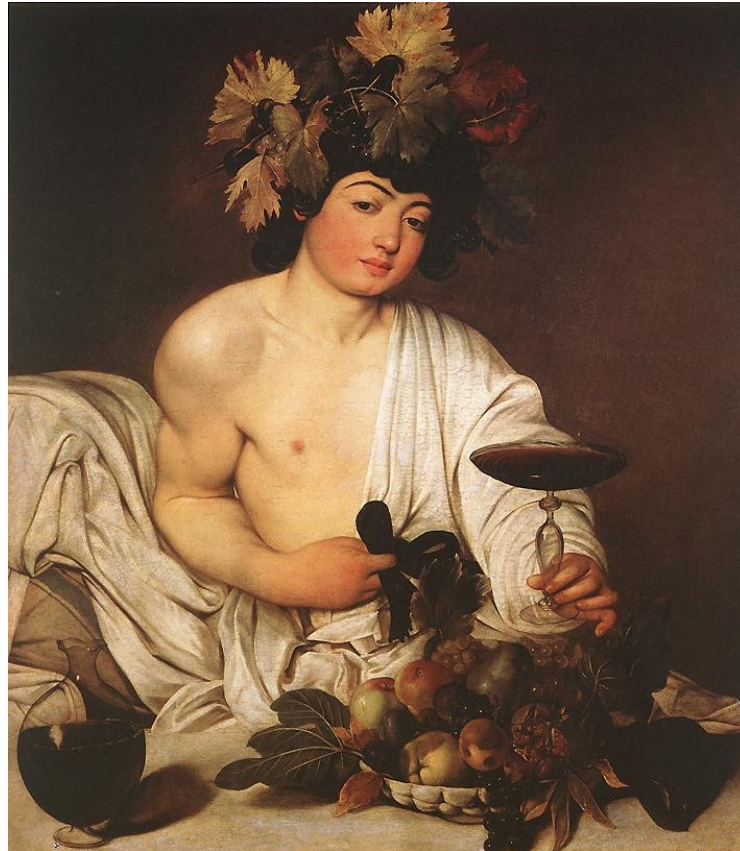
Caravaggio, Bacchus (1595)