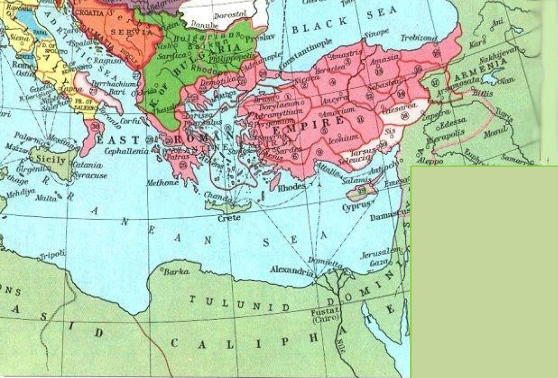
Η Βυζαντινή αυτοκρατορία και τα γειτονικά της κράτη στις αρχές του 10 ου αι.