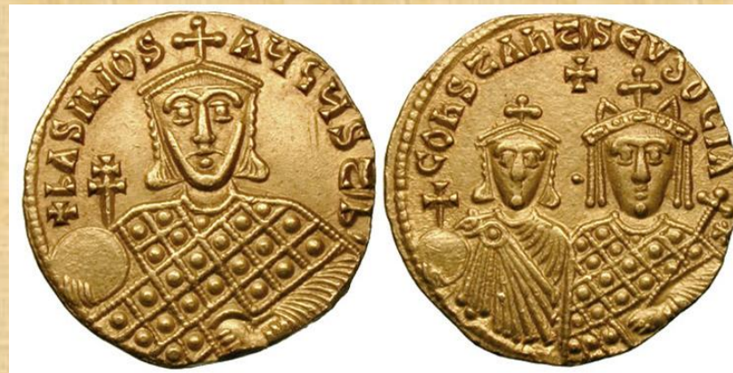
Νομίσματα του Βασιλείου Α΄ (867-886)