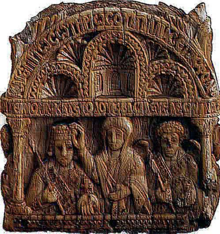
Ο Λέων Στ΄ στέφεται από την Θεοτόκο

ελεφαντοστό (άνω τμήμα σκήπτρου;) Βερολίνο