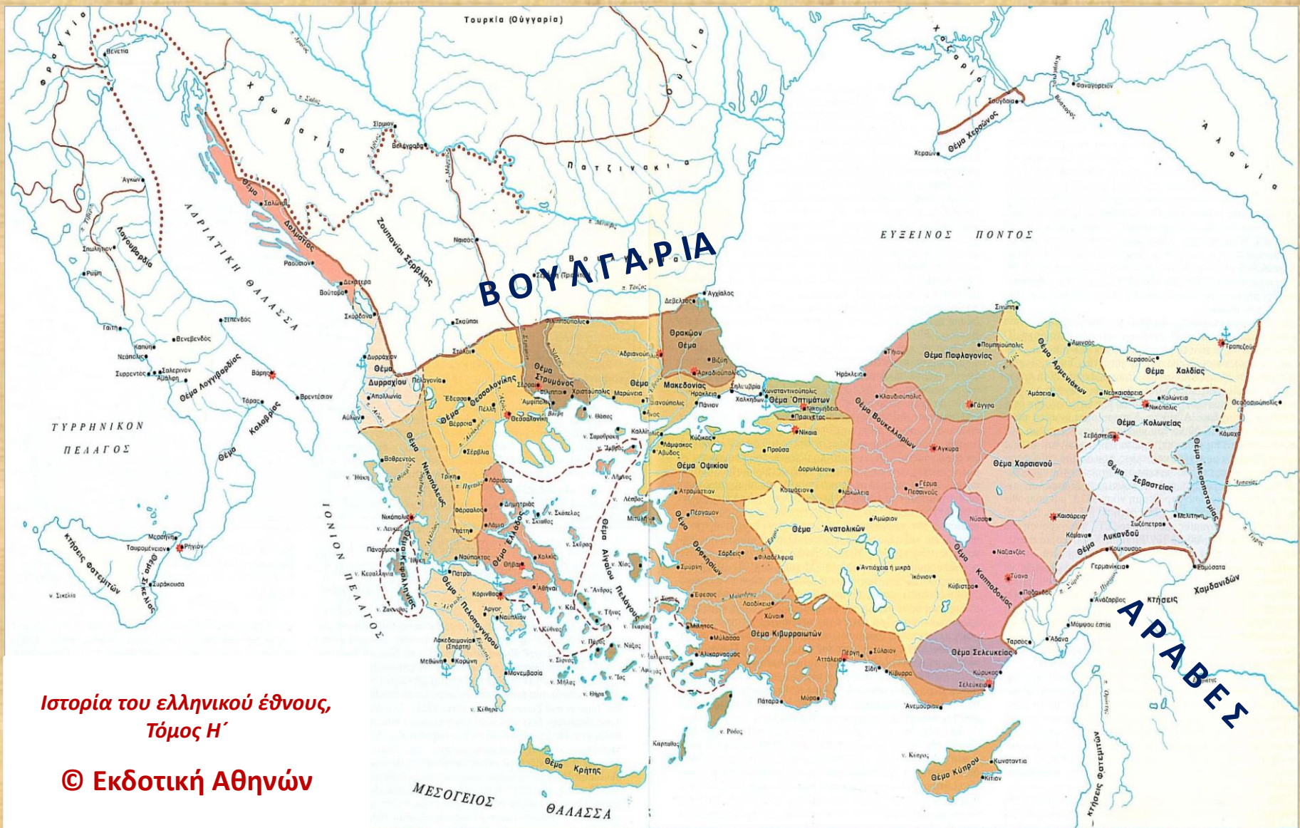
Η Βυζαντινή αυτοκρατορία και τα τότε θέματά της στα μέσα περίπου του 10 ου αι. (πριν τη βυζαντινή επέκταση στην Ανατολή και τα Βαλκάνια)