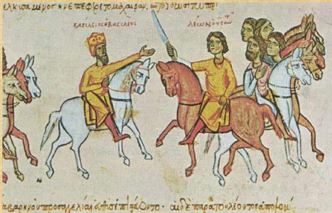
Ο Λέων Στ΄ και ο πατέρας του Βασίλειος Α΄ έφιπποι

ελεφαντοστό (άνω τμήμα σκήπτρου;) Βερολίνο