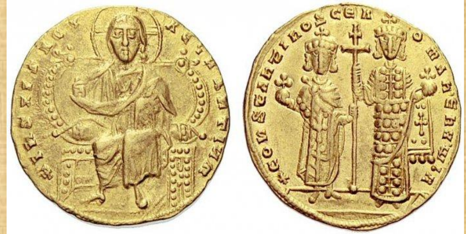
Νομίσματα των Κων/νου Πορφυρογέννητου - Ρωμανού Α΄ Λακαπηνού