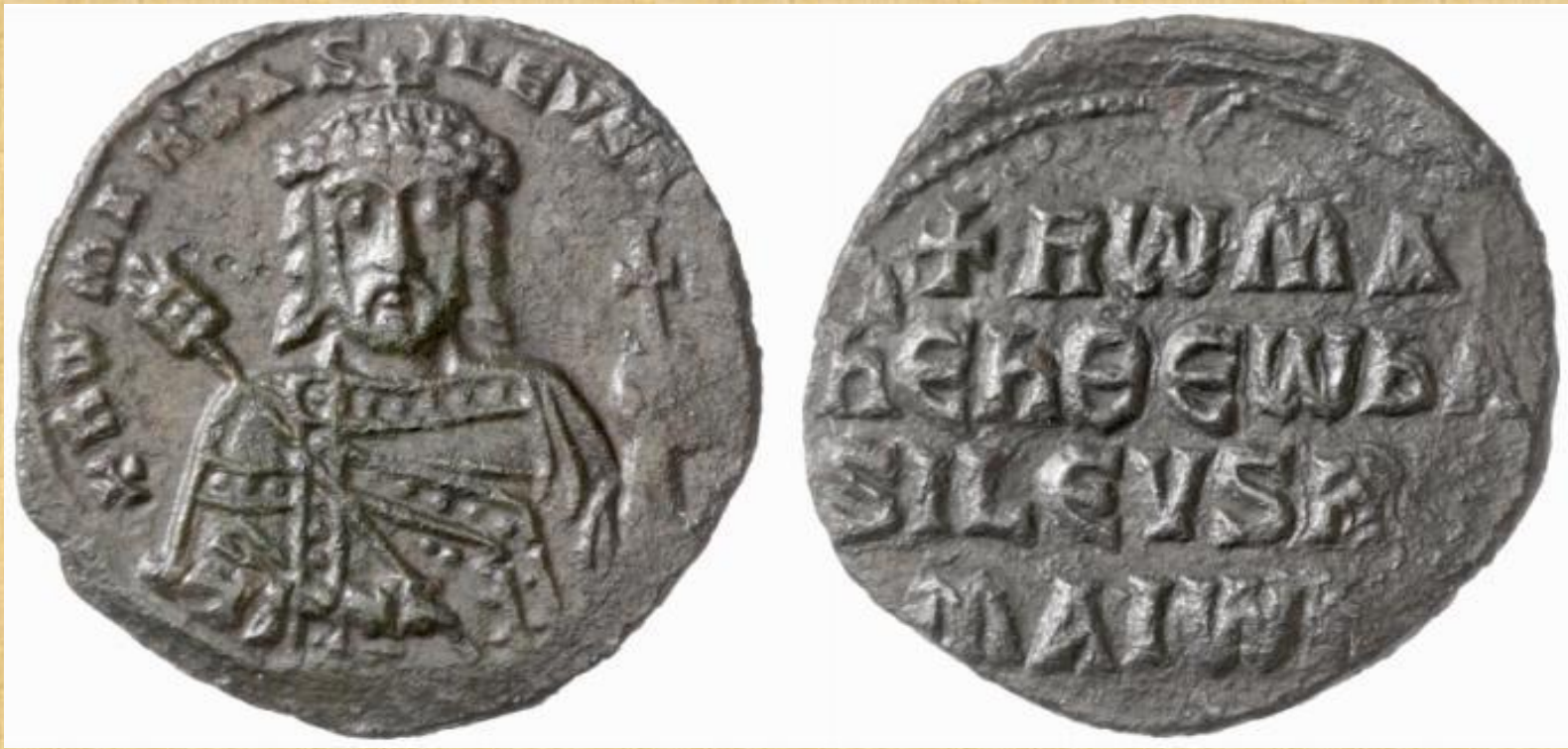
Φόλλις του Ρωμανού Α΄ Λακαπηνού (920-944)