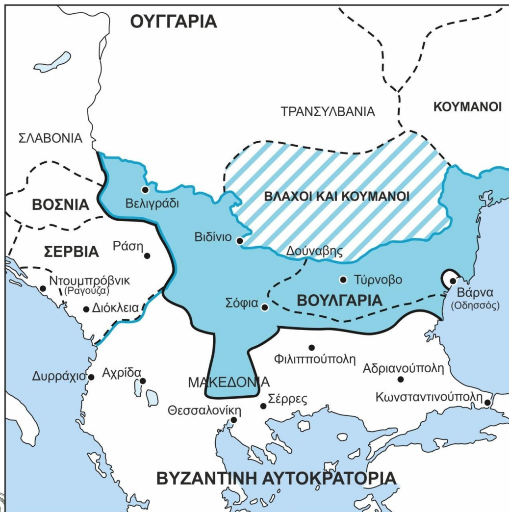
Εικόνα 3. Απεικονίζεται το επανιδρυμένο βουλγαρικό κράτος (1186) και η άμεση επεκτατική του τάση σε βάρος τόσο σερβικών όσο και βυζαντινών εδαφών (με ρίγες οι περιοχές υπό χαλαρή εξάρτηση).