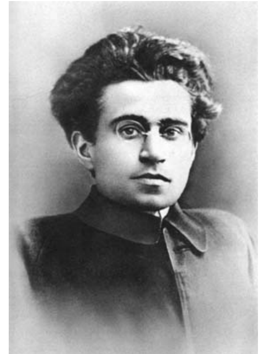
Εικόνα 1: Antonio Gramsci

Αυτή η ‘ηγεμονία’ ενσωματώνεται στον τρόπο που ζούμε και σκεπτόμαστε. Ουσιαστικά, είναι αποτέλεσμα καταπίεσης και είναι οι ιδέες και η σοφία του κατεστημένου. Στην εκπαιδευτική δραστηριότητα, η ηγεμονία αντιπροσωπεύεται από τον εκπαιδευτή. Μέσω του εκπαιδευτή, μεταδίδονται οι ιδέες που εξυπηρετούν το κατεστημένο και οριοθετούνται οι σκέψεις και οι πράξεις των εκπαιδευομένων.