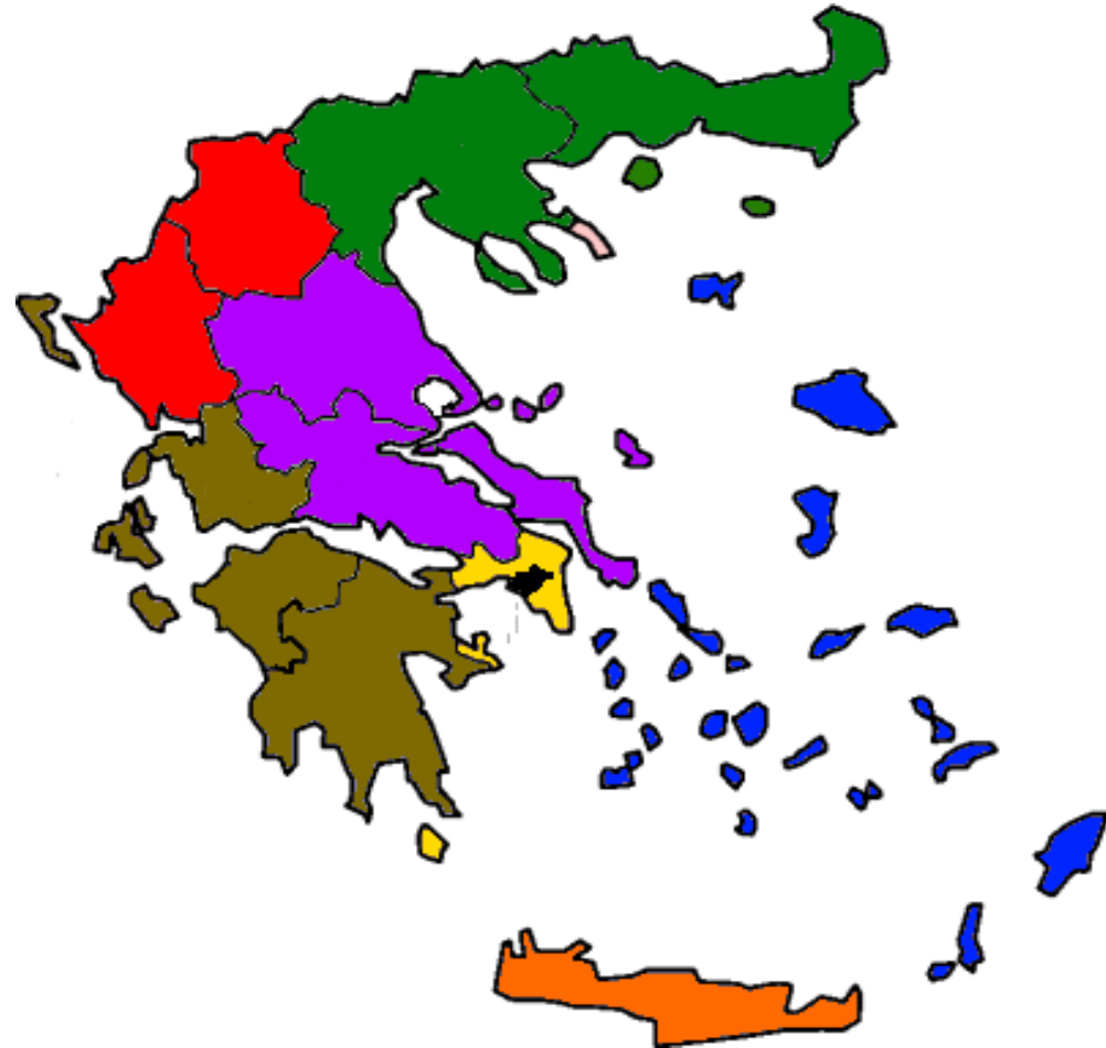
Οι επτά αποκεντρωμένες διοικήσεις