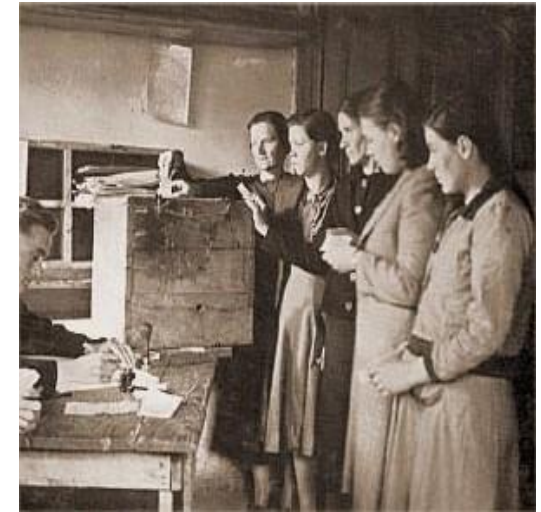
Φθινόπωρο 1943: Εκλογές στην «Ελεύθερη Ελλάδα», όπου ψηφίζουν για πρώτη φορά και οι γυναίκες