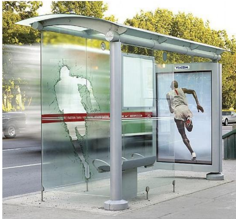
A transparent decal was placed on this transit shelter to show distance runner Bernard Lagat crashing through.