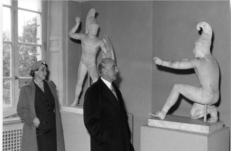
Ο Αλέξανδρος Παπάγος στο Μουσείο του Μονάχου (1054).