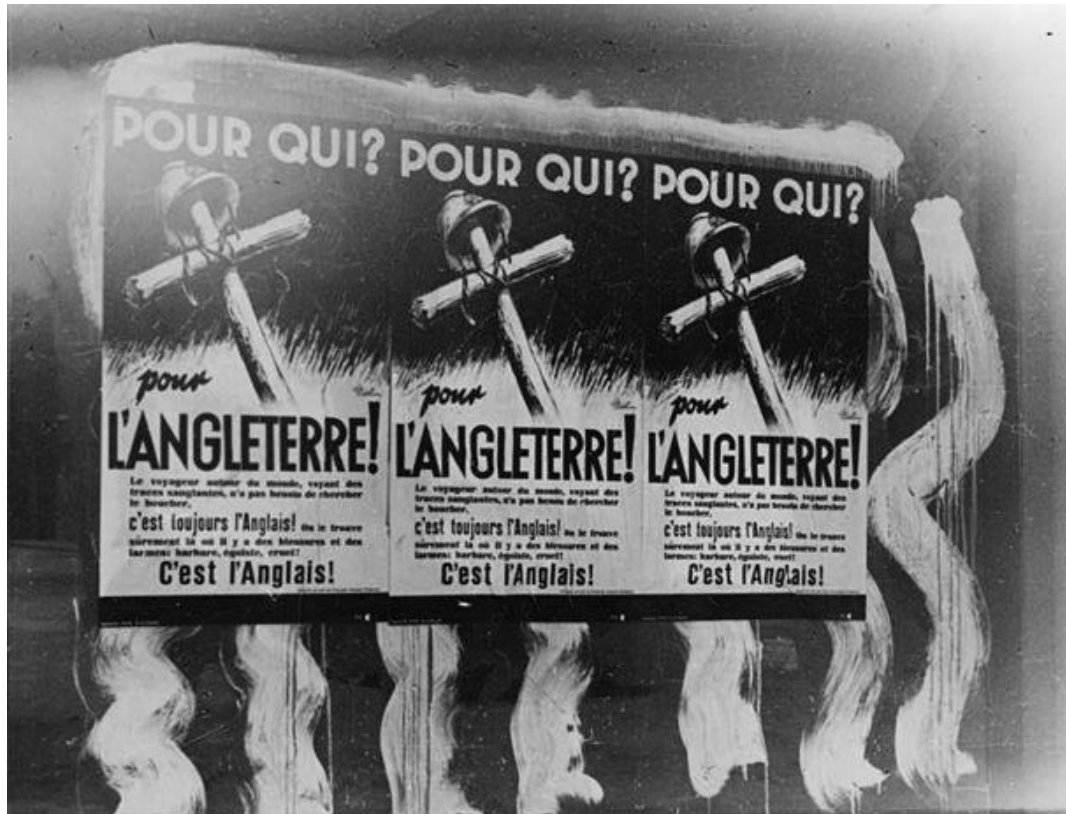
Bundesarchiv, Bild 183-L12579 Foto: Eieling | Juni 1940