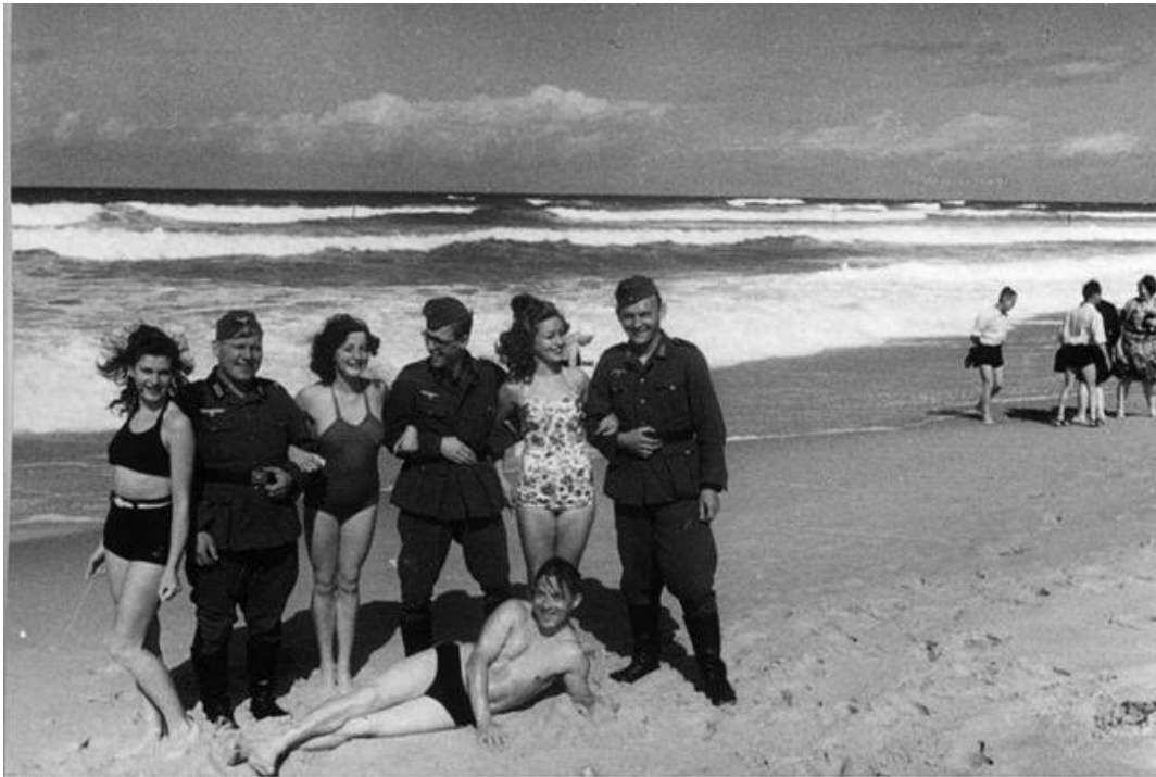
1940 August - September