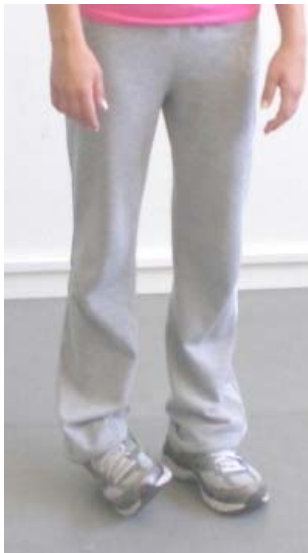
Στάση σώματος που δηλώνει αβεβαιότητα (Χατζόπουλος, 2012, σελ. 156).