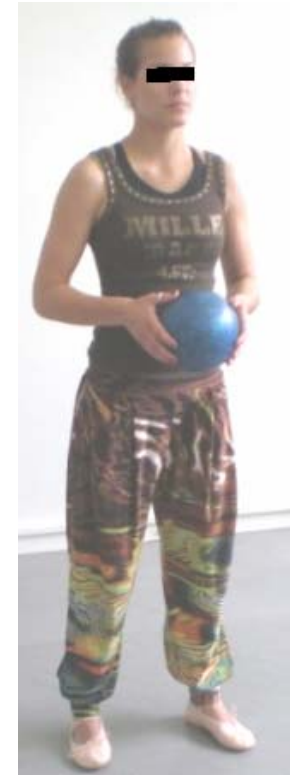
Στάση σώματος που δηλώνει σιγουριά (Χατζόπουλος, 2012, σελ. 155).