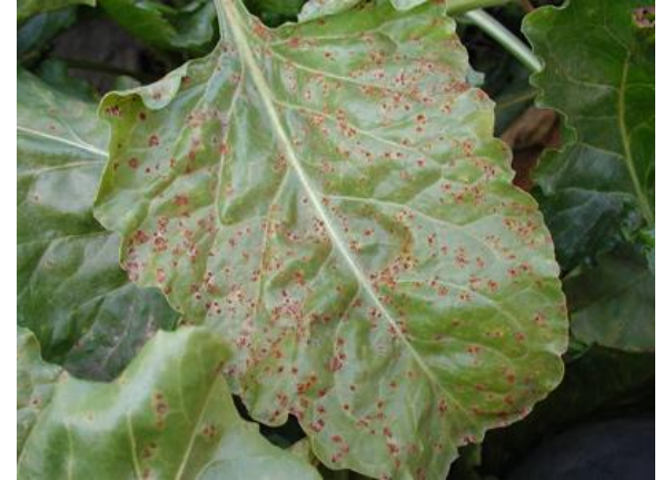
Ουρεδοσωροί σε φύλλο