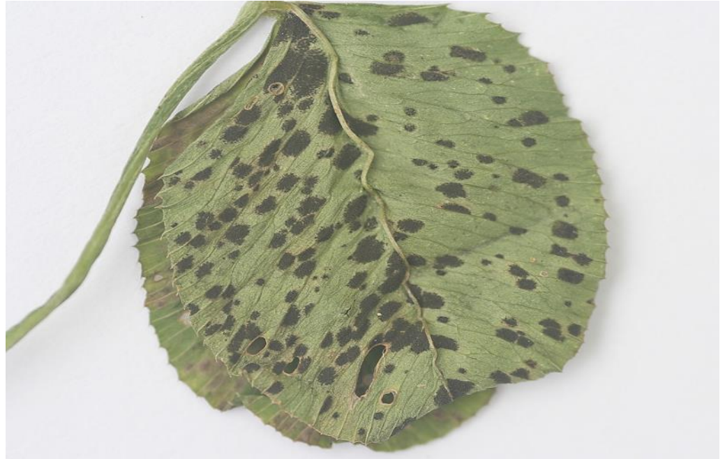
Τελειοσπορί σε φύλλο τριφυλλιού