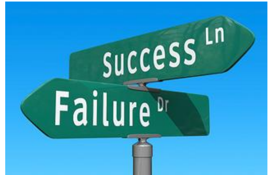
Εικόνα 4: Σταυροδρόμι ανάμεσα στην αποτυχία και την επιτυχία