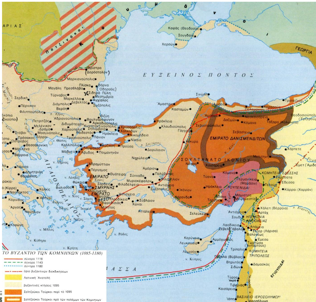
Εικόνα 3. Απεικονίζονται (μεταξύ άλλων) τα λατινικά κράτη που ιδρύθηκαν κατά την α΄ σταυροφορία και οι προσπάθειες των Κομνηνών να θέσουν την ηγεμονία της Αντιοχείας υπό βυζαντινή επικυριαρχία.