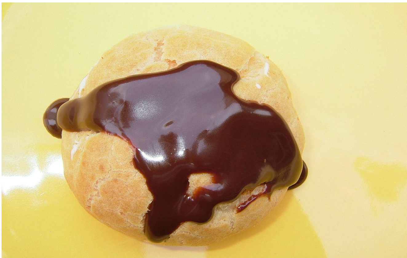
Profiterole choc"