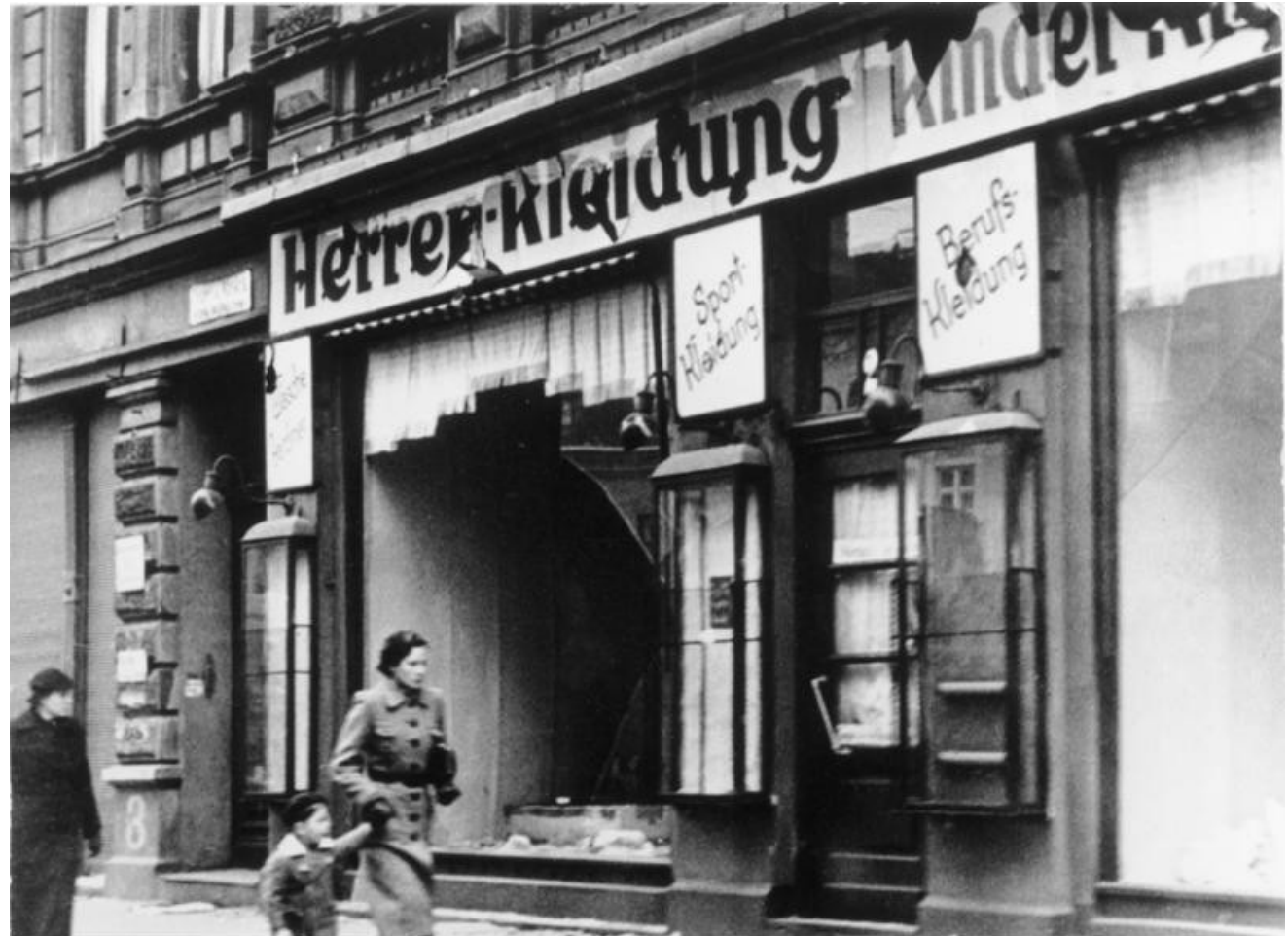
November 1938

https://upload.wikimedia.org/wikipedia/commons/f/f9/Bundesarchiv_Bild_146-1970-083-44%2C_Magdeburg%2C_zerst%C3%B6rtes_j%C3%BCdisches_Gesch%C3%A4ft.jpg